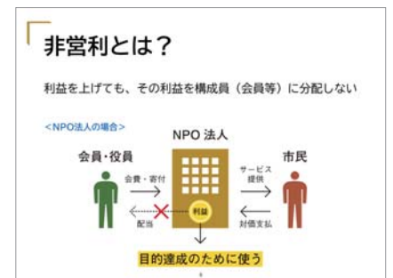
▲NPO法人入門講座のスライドサンプル「非営利とは？」

講座の最後には、質問タイムもあります。 気になることがあったら、ぜひお気軽 にお尋ねください。また、もし受講後に悩 みが出てきた時は、個別にじっくりと相談 できる「専門相談」もありますので、こ ちらもご活用ください。みなさまのご参加 お待ちしております。