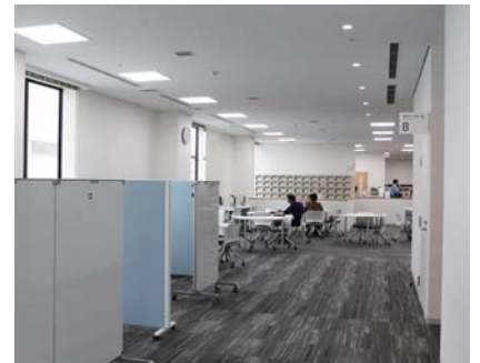
▲あすみんの奥から見た風景はこのように感じます

新しい施設が、短期間でこれほどの利用に恵まれたのは、ひとえに、市民の皆さまの公益活動へ向けた「想い」の賜物だと感じております。新センター長を拝命するにあたり、これまでのセンターを支えてこられた皆さまのお気持ちや、築いて