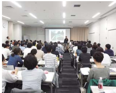
▲4/26開催の災害ボランティア講座には多くの方が参加

青年センターの閉館に伴い、今泉の天神クラスの4階へと移転しました。その距離、わずか600メートルほどの移動ですが、新ビルの1フロアを有する移転後のあすみんは、その面積も、機能も、従来を上回る施設として生まれ変わりました。