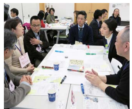
▲活発な議論が交わされた。このような機会を活用したい