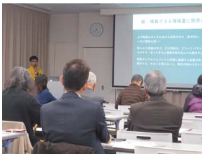
▲「メディア制作講座」当日の様子