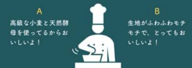
▲①講座スライドより「どちらの表現が響くでしょう？」