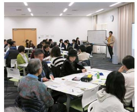
▲2/15に開催された共働カフェ、行政とNPOが出会う場に