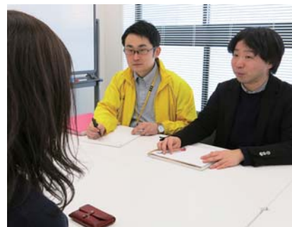
▲ 専門相談の様子。2人の相談員で対応いたします

の通り、団体の運営資金の確保や運用につ いて相談できます。「NPO法人などの社会 的起業や地域貢献につながる事業を営む 方」、「ソーシャルビジネス分野での開業を お考えの方」、「地域貢献につながる事業を ステップアップさせたい方」などにオス スメです。毎月第2土曜日の10時半～13時半、 第4火曜日の16時～19時の時間帯に実施し ています。1回の相談は1時間までです。