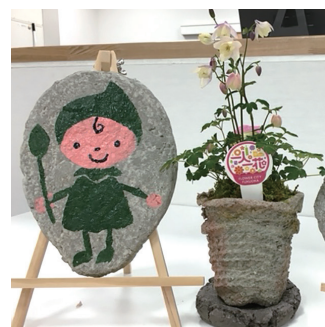
【定員】なし 【参加費】300円

環境にやさしい材料で、お花の鉢を作りましょう。新聞紙をパルプ状にしたものを、セメントと水で練って作ります。手でこねて植木鉢の形に整えたら出来上がり!1つは持ち帰っていただき、もう1つはイベントで花を植えて展示します。大人も子どもも楽しみながら、自分だけのエコ鉢を作ってみませんか?