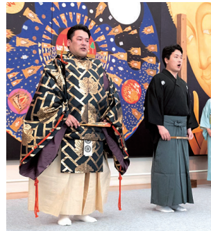
【定員】なし 【参加費】無料

本日は能楽初心者の方に向けて、能、大連吟の魅力をわかりやすく解説します。日頃は「謡でつなげる、にっぽんのこころ」をコンセプトにかつて祝いの席で謡われていた「高砂」を100人で稽古しプロと同じ舞台に立つ参加型企画をし、能楽の稽古をすることで日本の美意識、習慣を伝えることができればと20代から90代の参加者の皆様と一緒に稽古に励みます。