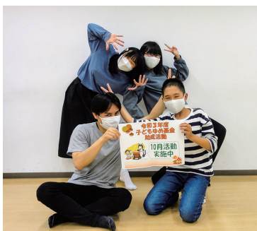
【定員】なし 【参加費】無料

NPO法人アイスでは、2021年9月から表現教育のボランティアリーダー育成活動を始めました。受講生の中学生が、学んだことを活かして、表現を使って緊張をほぐし、互いに知り合う30分のワークショップを行います。どうぞご参加ください。