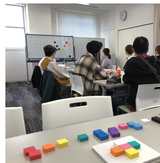
【定員】ワークショップ2-3名 【参加費】無料

この機会に、「心理学について」そして当団体についてお伝えしたいと思います。さらに、時間が許す限り、カラーキュービックスを並べて「抱えているモヤモヤを少し軽くする」簡単な体験をしていただきたいと考えてます。