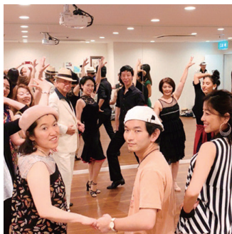
【定員】なし 【参加費】無料

人々が新型コロナウイルス蔓延という今まで経験したことのない不安や孤独を感じ、楽しみも奪われている中、輪になって踊り、人が繋がり笑顔の輪を広げて元気を取り戻すことができる「ルエダ」。SDGsのスローガン「誰も置きざりにしない」という令和の時代に相応しい、新しい日本の文化としてご紹介致します。