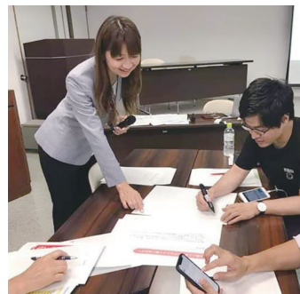
【定員】なし 【参加費】無料

「やさしい日本語」とは、日本語を母語としない外国人など、日本語の理解やコミュニケーションに関して何らかの困難を抱えている人たちのために配慮した日本語のことです。私たちは全員がやさしい日本語認定講師のグループです。今日は、やさしい日本語のポイントや私たちの普及活動を紹介しします。