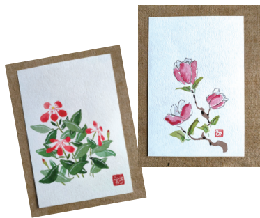
【定員】なし 【参加費】500円

普段何気なく見ている草花を描く事で新しい発見に気付く事があり、同時に季節を感じる事もできると思います。