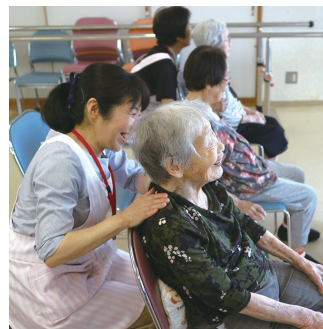
【定員】なし 【参加費】無料

セラピューティック・ケアは英国赤十字社発のボランティアのツールで洋服を着たまま両手のぬくもりだけで行えるケア方法です。生老病死どの場面でも心をこめて優しくなでることで、緊張した心と身体をほぐすことができるメンタルケアです。ご一緒にボランティアに参加しませんか？