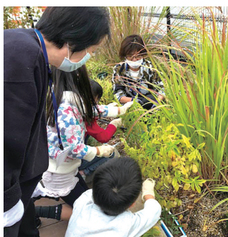
【定員】先着15名 【参加費】無料

屋上の小さな花壇で、子どもたちが花を植えたり、花がらを摘んだり水遣りなどの活動をしています。幼児と小学生が土や植物と触れ合いながら、一緒に活動する中で、みんなと協力したり、達成感を感じる様子や、成長する子どもたちの笑顔にボランティアのスタッフも元気をもらっています。