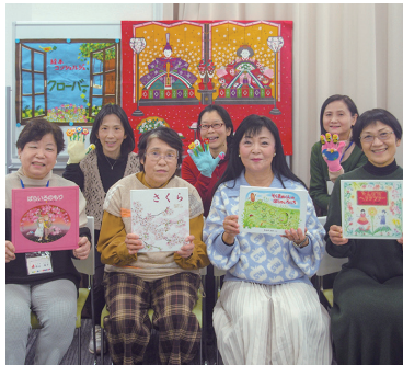
【定員】なし 【参加費】無料